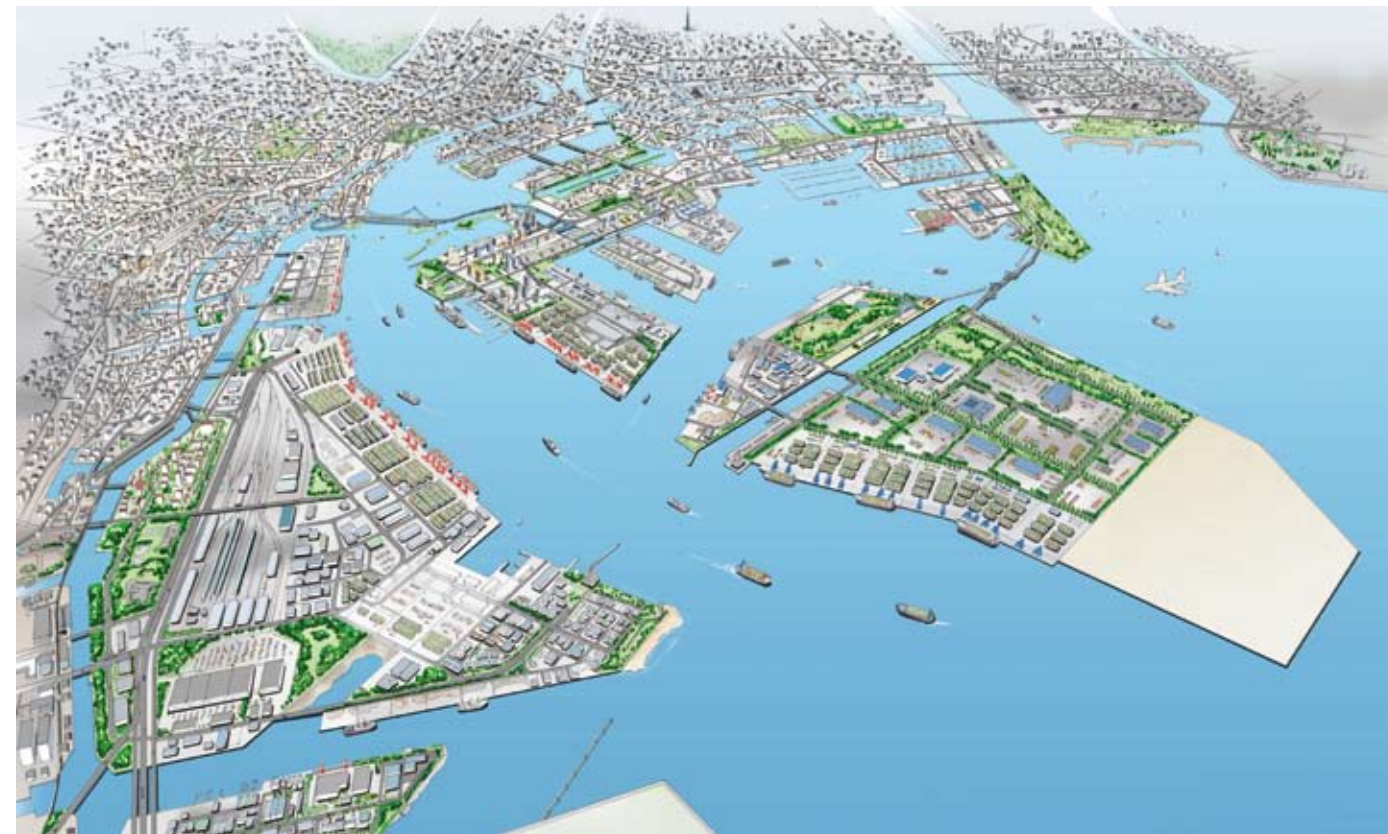
第8次改訂港湾計画イメージパース 8th Revised Port and Harbor Plan Prospective Illustration

Based upon the "Port of Tokyo Comprehensive Congestion Measures" established in February 2014, multilaterally implement short-term and immediately effective efforts centered around the radical function-strengthening measures and aim for the resolution of traffic congestion in the Port of Tokyo.