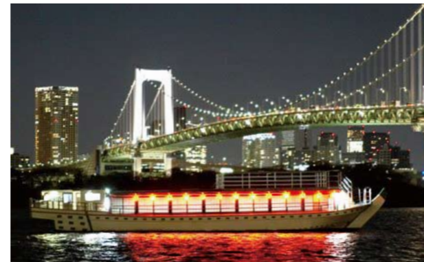
レインボーブリッジと屋形船 Rainbow Bridge and a houseboat

While improving the convenience of movement in the coastal area in terms of both touristic and everyday means of transportation, promote the expansion of a sea traffic network leveraging the diverse appeal of the Port of Tokyo.