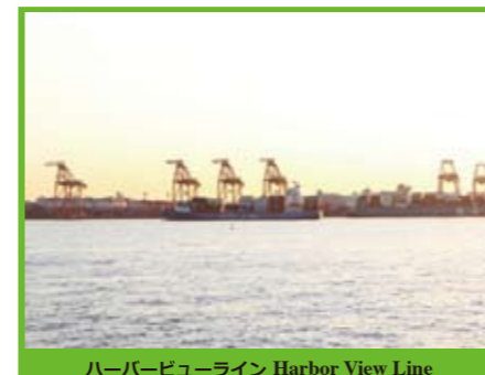
ハーバービューライン Harbor View Line