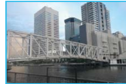
キャナルウォークライン Canal Walk Line