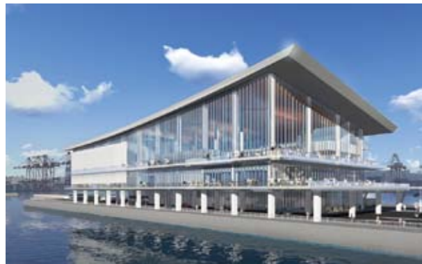
新客船ふ頭のイメージ New cruise ship terminal (image)

観光と日常の足の両面から臨海部の移動利便性を向上させるとともに、東京港の持つ多彩な魅力を活かした海上交通ネットワークの拡充を推進する。