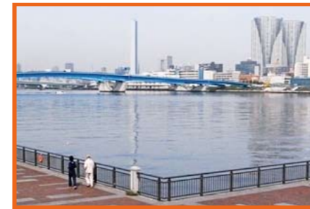
シーサイドアミューズライン Seaside Amuse Line