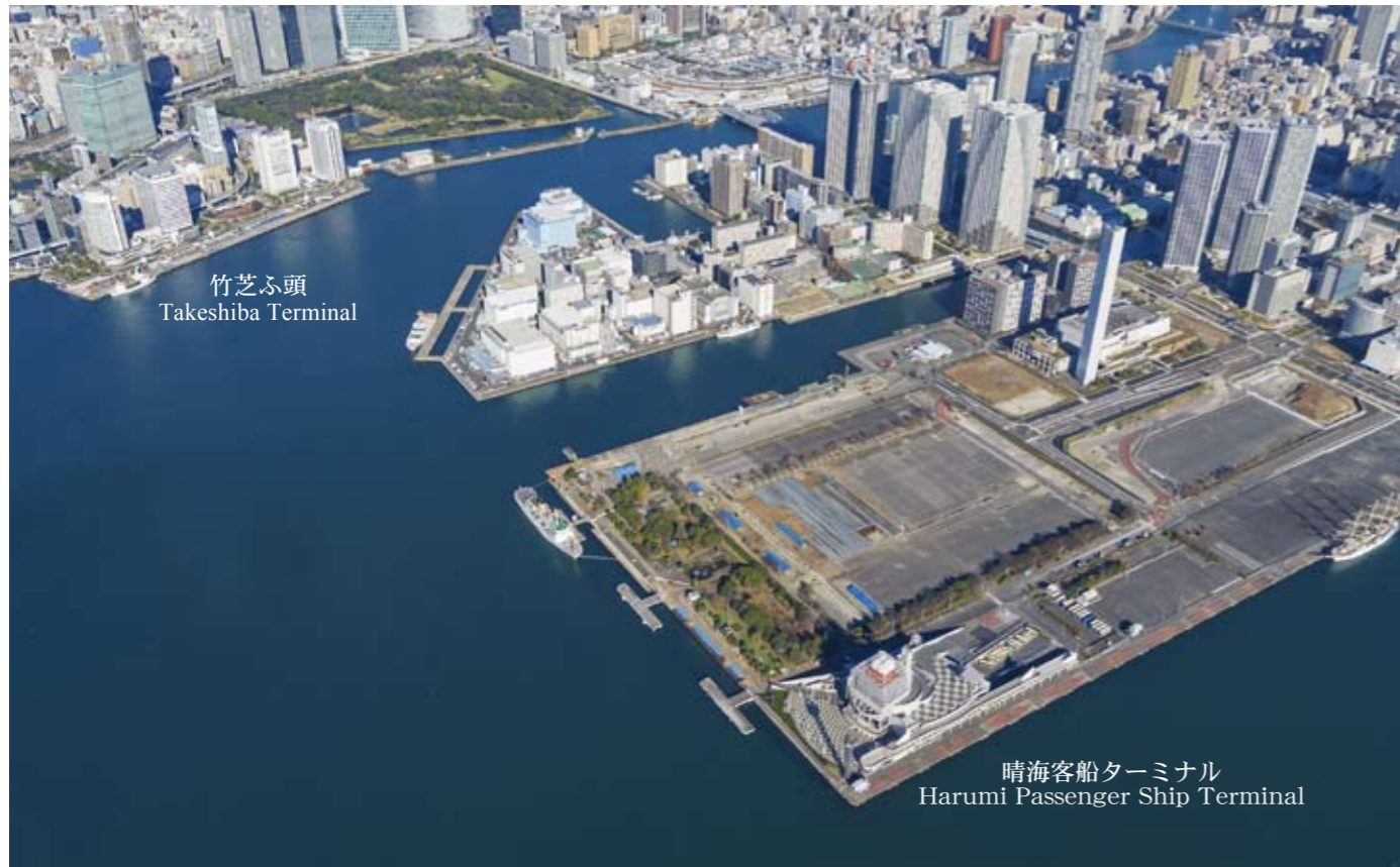
竹芝ふ頭 Takeshiba Terminal