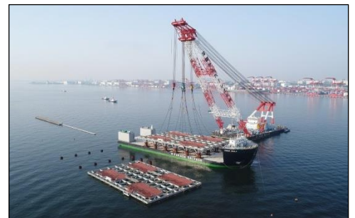
ジャケット据付状況 H30.4写真