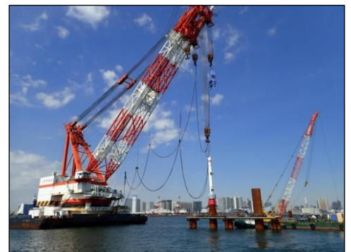
鋼管杭打設状況 H30.4写真