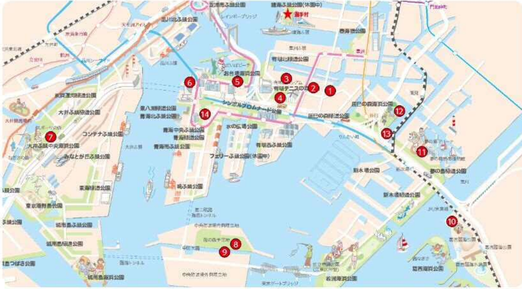
臨海地域における東京2020オリンピック・パラリンピックの競技会場

2020年夏期には東京オリンピック・パラリンピック競技大会が開催されます。臨海地域には、多くの競技会場の他、選手村などの大会関連施設が計画されています。海上公園内や海上公園に近接して、多くの競技施設の整備が進んでいます。