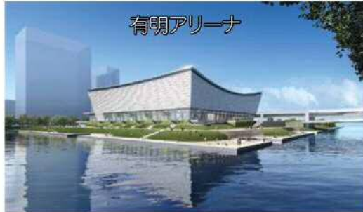
※平成27年10月時点の大会時イメージ図