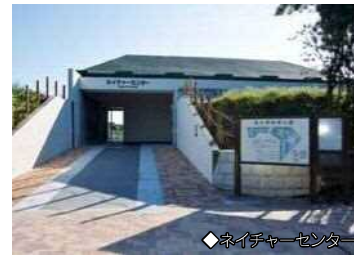
◆ネイチャーセンター