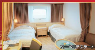
スーベリアステート