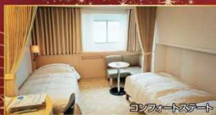
コンフォートステート

◎食事：朝1回、夕1回 ◎宿泊：船中泊 ◎最少催行人員：2名様 ◎添乗員：同行じませんが、船内では船内スタッフがお世話いたします。