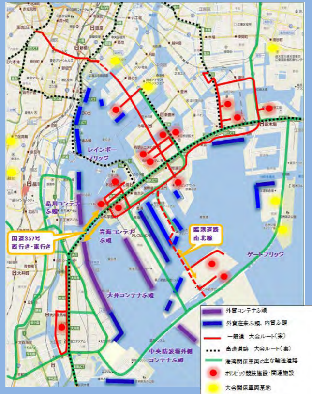
〈東京2020大会関連施設と東京港のふ頭位置図〉